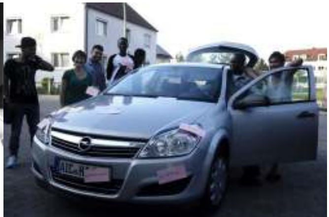
Stand: Mai 2016